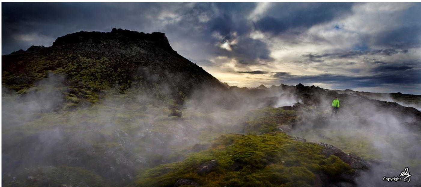
Í Eldvörpum er að finna kynngimagnaða náttúru þar sem jarðhitinn sveipar umhverfið dulúð.