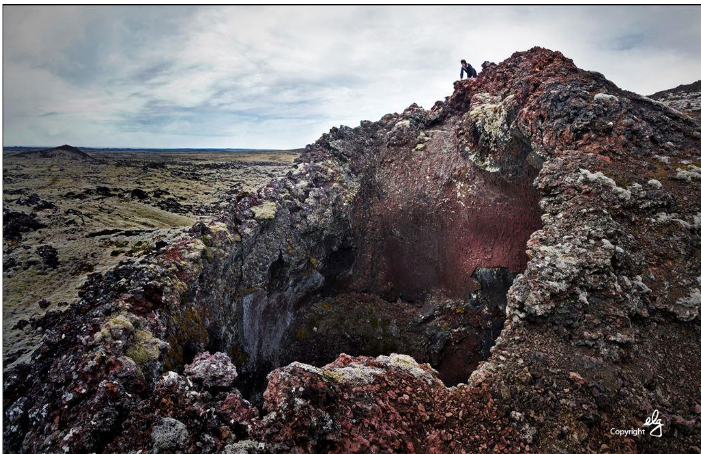
Gægst ofan í einn gíganna. Gígaröðin öll er afar forvitnileg.